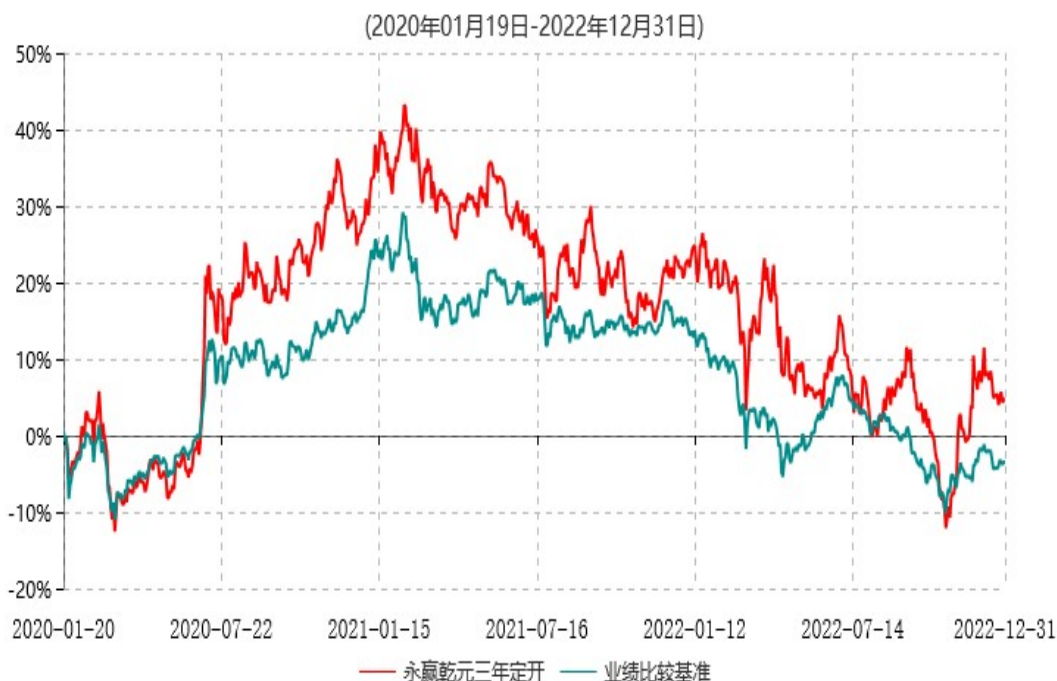
永赢乾元三年定期开放混合型证券投资基金累计净值增长率与业绩比较基准收益率历史走势对比图