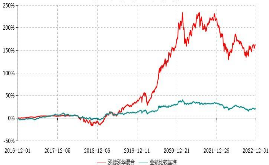
泓德泓华灵活配置混合型证券投资基金累计净值增长率与业绩比较基准收益率历史走势对比图 (2016年12月01日-2022年12月31日)

注：根据基金合同的约定，本基金建仓期为6个月，截至报告期末，本基金的各项投资比例符合基金合同关于投资范围及投资限制规定。