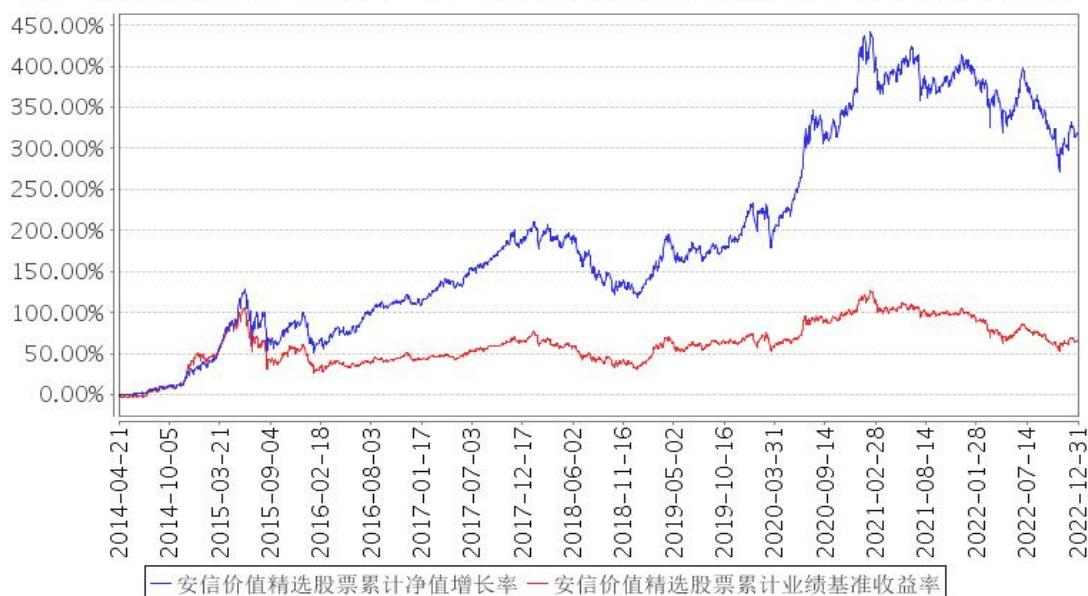
安信价值精选股票累计净值增长率与同期业绩比较基准收益率的历史走势对比图