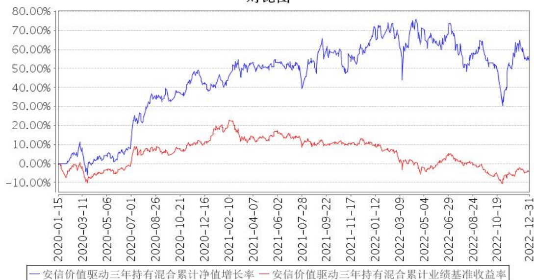
安信价值驱动三年持有混合累计净值增长率与同期业绩比较基准收益率的历史走势对比图