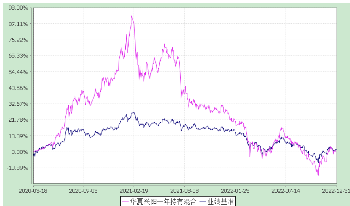
华夏兴阳一年持有期混合型证券投资基金 份额累计净值增长率与业绩比较基准收益率历史走势对比图 (2020年3月18日至2022年12月31日)