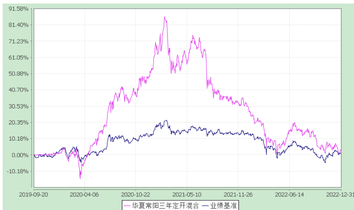
华夏常阳三年定期开放混合型证券投资基金 份额累计净值增长率与业绩比较基准收益率历史走势对比图 (2019年9月20日至2022年12月31日)