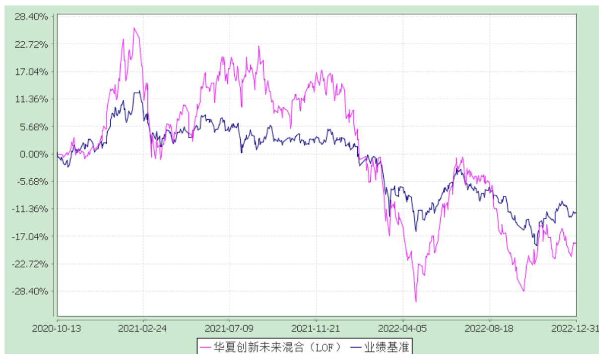
份额累计净值增长率与业绩比较基准收益率历史走势对比图 (2020年10月13日至2022年12月31日)