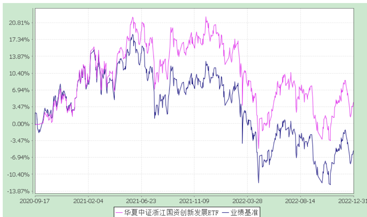
华夏中证浙江国资创新发展交易型开放式指数证券投资基金 份额累计净值增长率与业绩比较基准收益率历史走势对比图 (2020年9月17日至2022年12月31日)