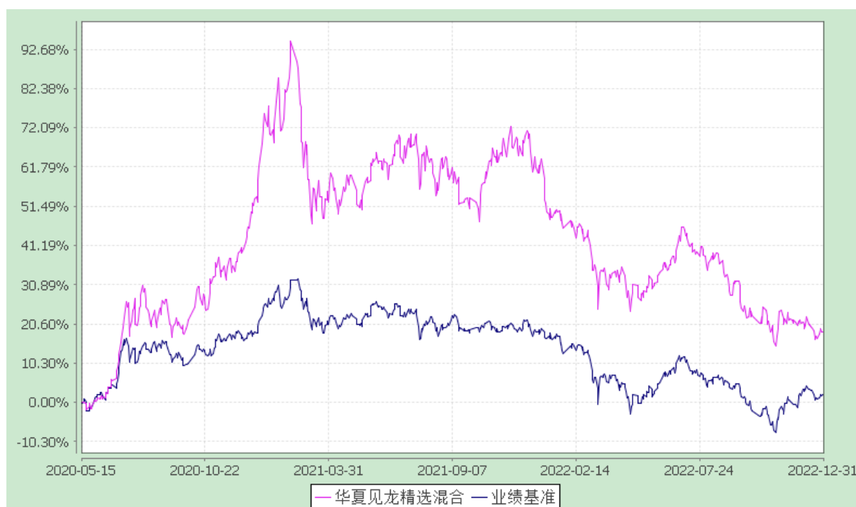
份额累计净值增长率与业绩比较基准收益率历史走势对比图 (2020年5月15日至2022年12月31日)

3.2.3 自基金合同生效以来基金每年净值增长率及其与同期业绩比较基准收益率的比较