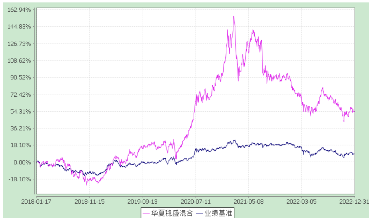
华夏稳盛灵活配置混合型证券投资基金 份额累计净值增长率与业绩比较基准收益率历史走势对比图 (2018年1月17日至2022年12月31日)