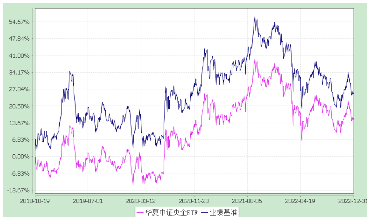
华夏中证央企结构调整交易型开放式指数证券投资基金 份额累计净值增长率与业绩比较基准收益率历史走势对比图 (2018年10月19日至2022年12月31日)