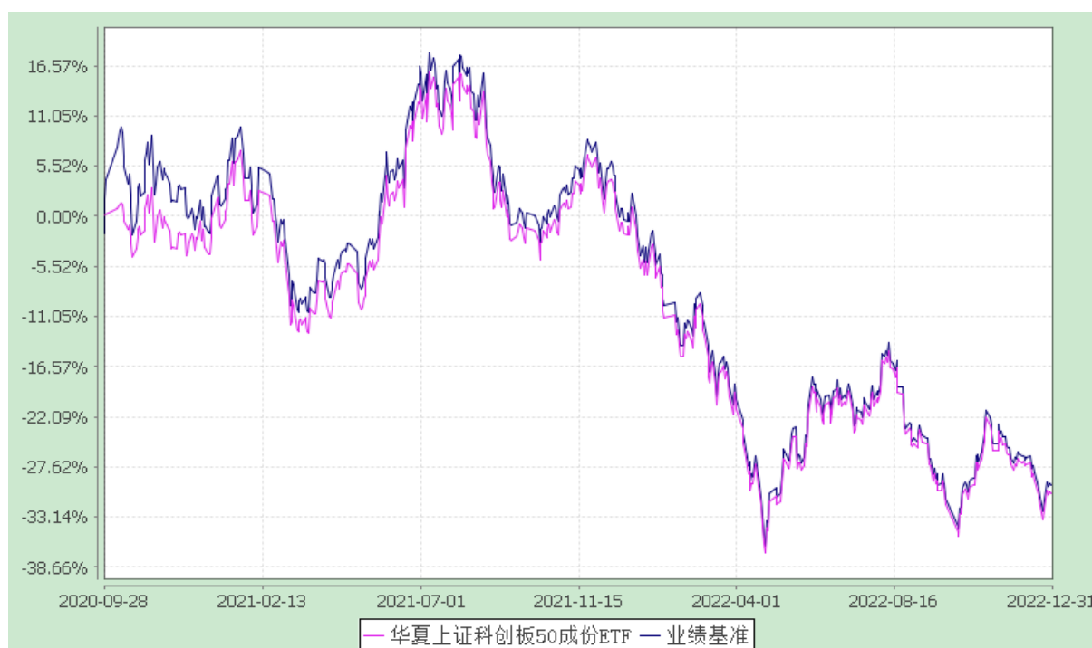
华夏上证科创板 50 成份交易型开放式指数证券投资基金 份额累计净值增长率与业绩比较基准收益率历史走势对比图 (2020 年 9 月 28 日至 2022 年 12 月 31 日)