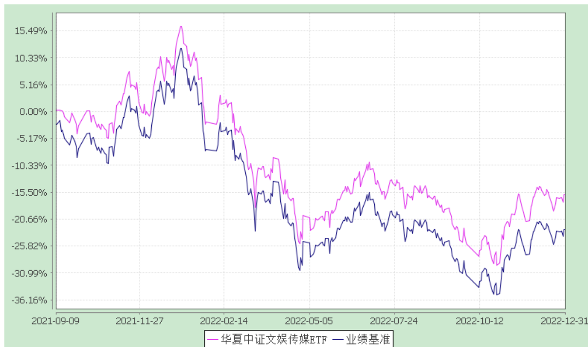
华夏中证文娱传媒交易型开放式指数证券投资基金 份额累计净值增长率与业绩比较基准收益率历史走势对比图 (2021 年 9 月 9 日至 2022 年 12 月 31 日)

注：根据本基金的基金合同规定，本基金自基金合同生效之日起 6 个月内使基金的投资组合比例符合本基金合同中投资范围、投资限制的有关约定。