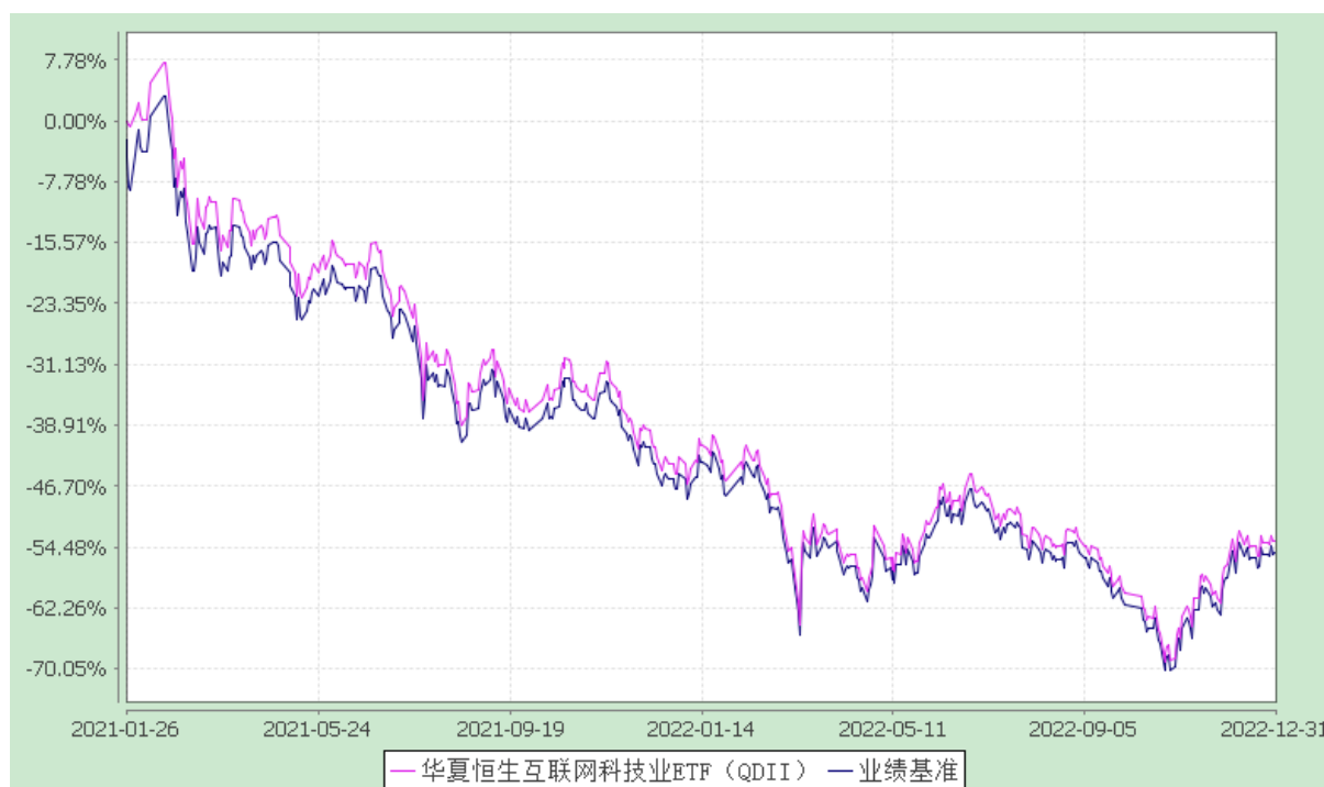
华夏恒生互联网科技业交易型开放式指数证券投资基金（QDII） 基金份额累计净值增长率与业绩比较基准收益率的历史走势对比图 (2021年1月26日至2022年12月31日)