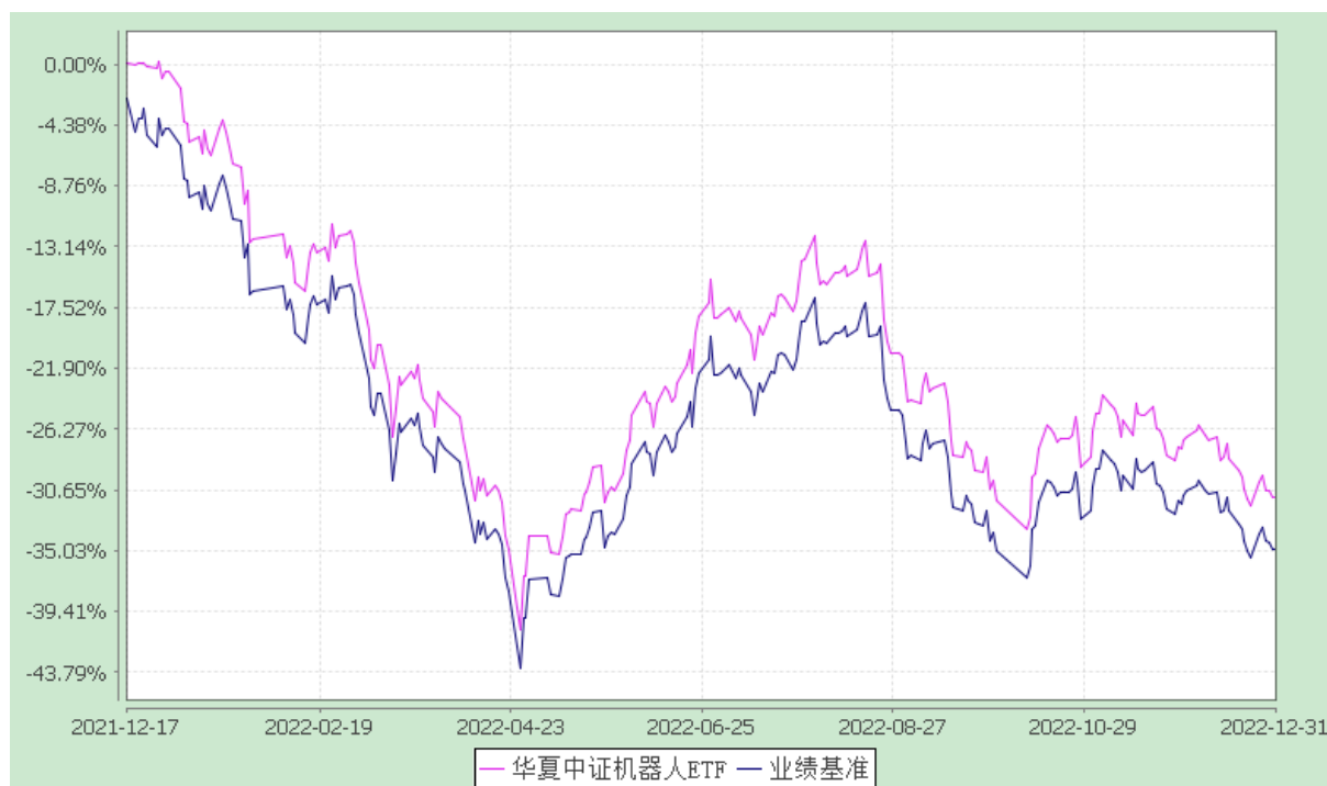
华夏中证机器人交易型开放式指数证券投资基金 份额累计净值增长率与业绩比较基准收益率历史走势对比图 (2021 年 12 月 17 日至 2022 年 12 月 31 日)

注：根据本基金的基金合同规定，本基金自基金合同生效之日起 6 个月内使基金的投资组合比例符合本基金合同中投资范围、投资限制的有关约定。