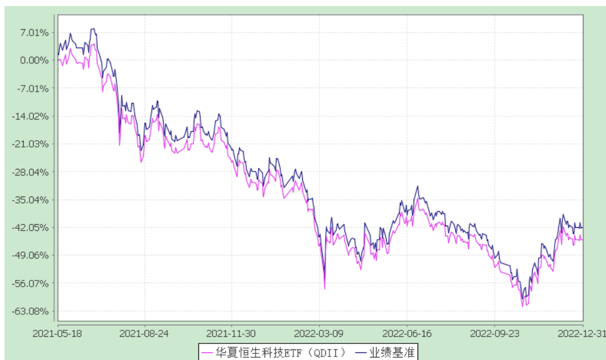
华夏恒生科技交易型开放式指数证券投资基金（QDII） 基金份额累计净值增长率与业绩比较基准收益率的历史走势对比图 (2021年5月18日至2022年12月31日)