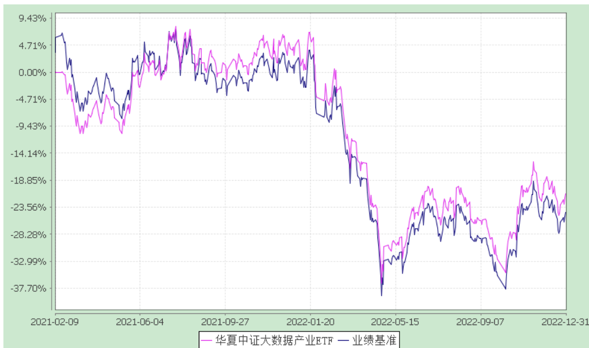
华夏中证大数据产业交易型开放式指数证券投资基金 份额累计净值增长率与业绩比较基准收益率历史走势对比图 (2021年2月9日至2022年12月31日)