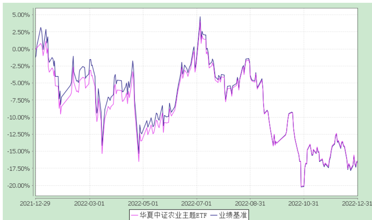
华夏中证农业主题交易型开放式指数证券投资基金 份额累计净值增长率与业绩比较基准收益率历史走势对比图 (2021 年 12 月 29 日至 2022 年 12 月 31 日)

注：根据本基金的基金合同规定，本基金自基金合同生效之日起 6 个月内使基金的投资组合比例符合本基金合同中投资范围、投资限制的有关约定。