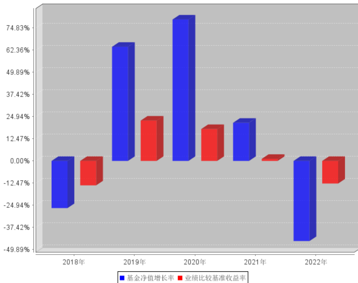
过去五年基金每年净值增长率及其与同期业绩比较基准收益率的对比图