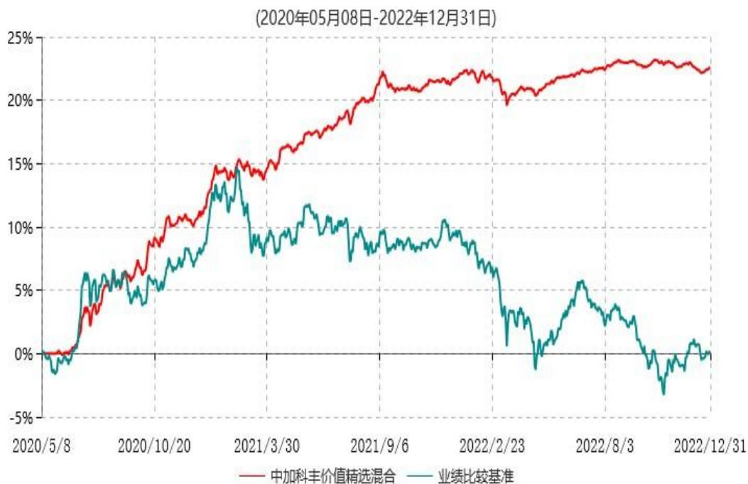
中加科丰价值精选混合型证券投资基金累计净值增长率与业绩比较基准收益率历史走势对比图