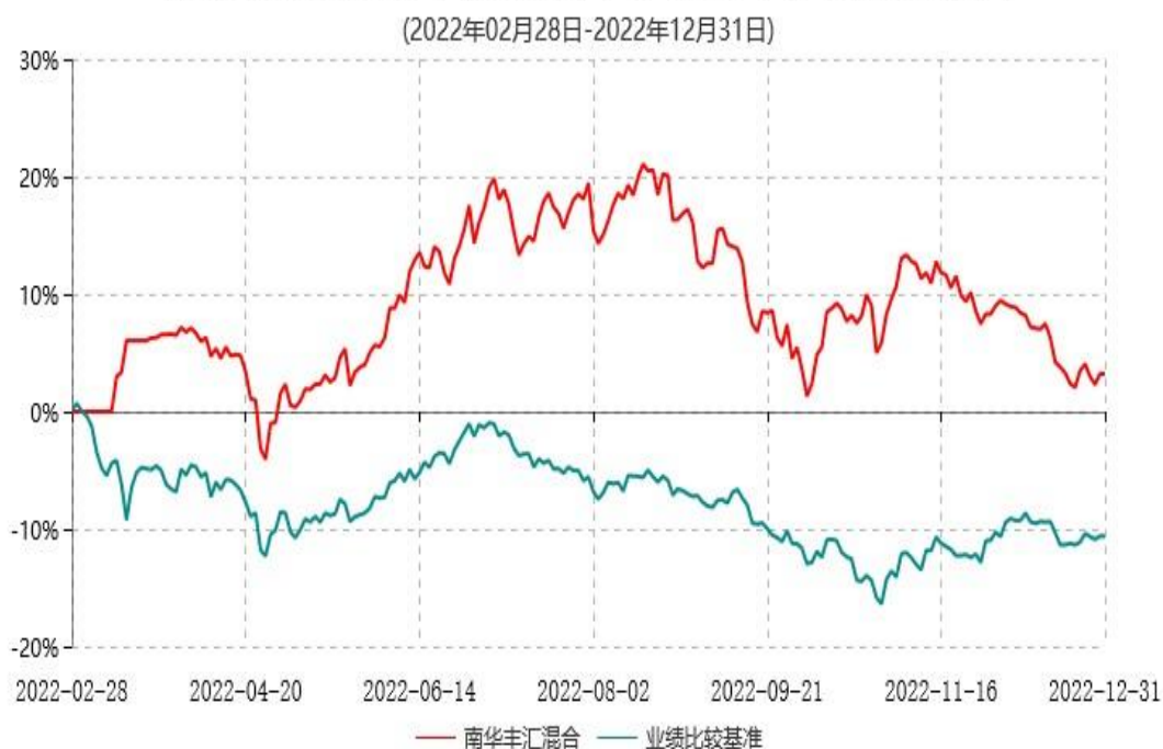
南华丰汇混合型证券投资基金累计净值增长率与业绩比较基准收益率历史走势对比图