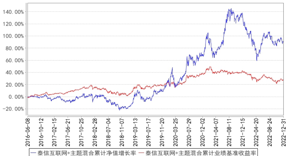
泰信互联网+主题混合累计净值增长率与同期业绩比较基准收益率的历史走势对比图