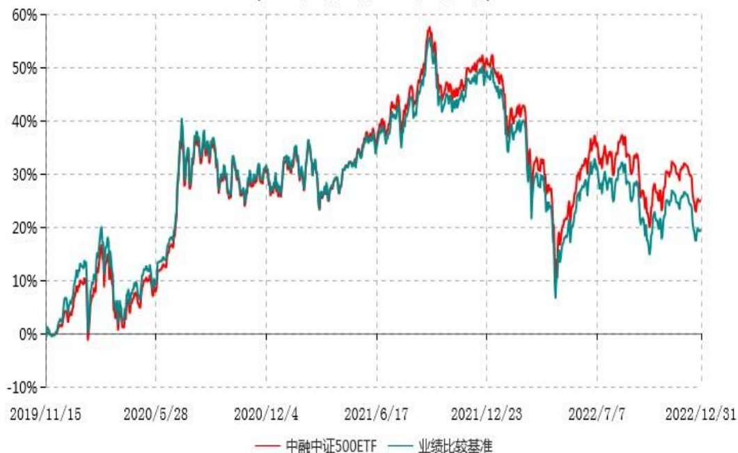
中融中证500交易型开放式指数证券投资基金累计净值增长率与业绩比较基准收益率历史走势对比图 (2019年11月15日-2022年12月31日)