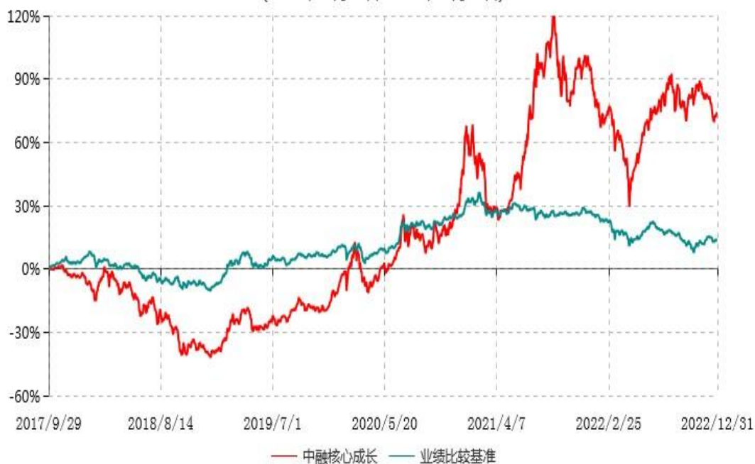
中融核心成长灵活配置混合型证券投资基金累计净值增长率与业绩比较基准收益率历史走势对比图 (2017年09月29日-2022年12月31日)

注：按基金合同和招募说明书的约定，本基金自基金合同生效日起6个月内为建仓期，建仓期结束时本基金的各项投资比例符合基金合同的有关约定。