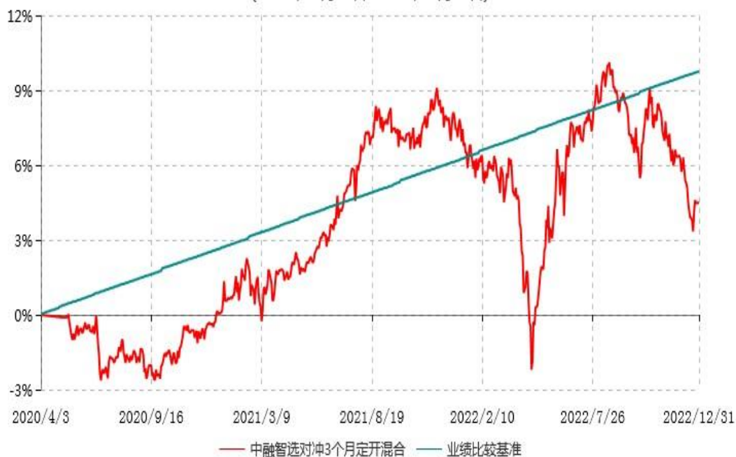
中融智选对冲策略3个月定期开放灵活配置混合型发起式证券投资基金累计净值增长率与业绩比较基准收益率历史走势对比图 (2020年04月03日-2022年12月31日)

注：按基金合同和招募说明书的约定，本基金自基金合同生效日起6个月内为建仓期，建仓期结束时本基金的各项投资比例符合基金合同的有关约定。