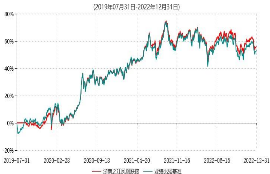
浙商汇金中证浙江凤凰行动50交易型开放式指数证券投资基金联接基金累计净值增长率与业绩比较基准收益率历史走势对比图

注：本基金合同生效日为2019年07月31日。基金合同生效日当年的相关数据和指标按实际存续期计算，不按整个自然年度计算。