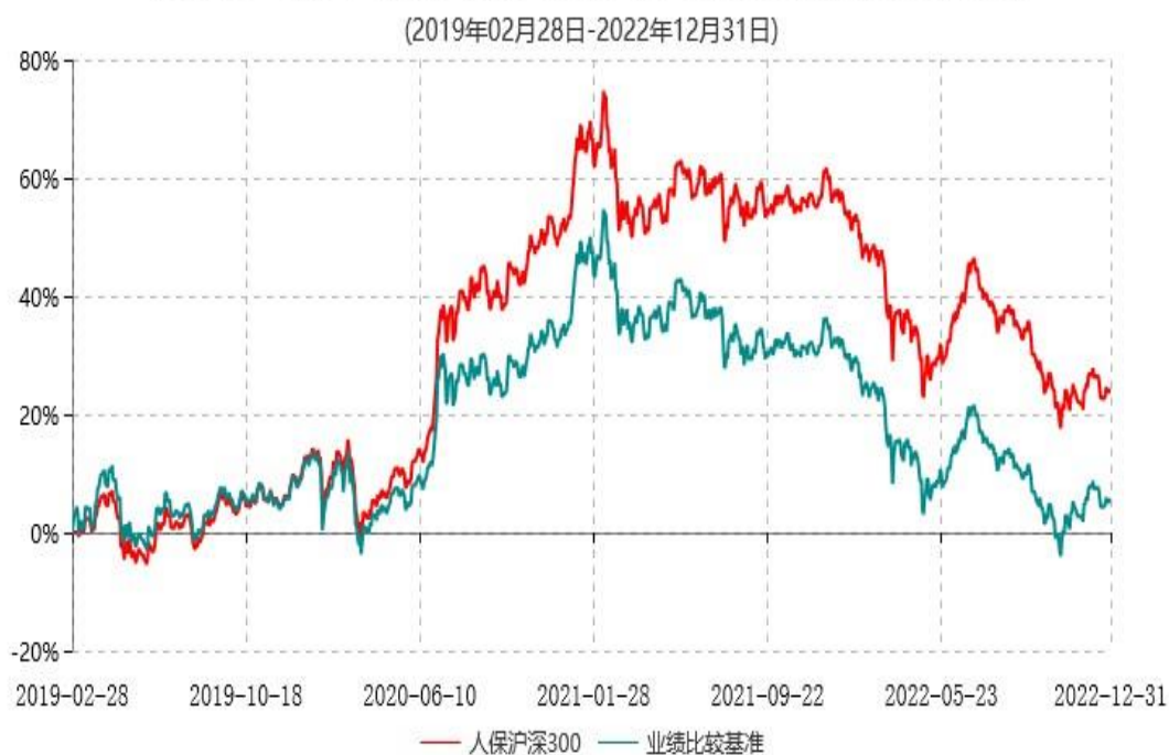
人保沪深300指数型证券投资基金累计净值增长率与业绩比较基准收益率历史走势对比图

注：1、本基金基金合同于2019年2月28日生效。根据基金合同规定，本基金建仓期为6个月，建仓期满，本基金的各项投资比例应符合基金合同的有关约定。