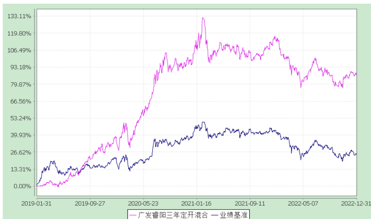
广发睿阳三年定期开放混合型证券投资基金 份额累计净值增长率与业绩比较基准收益率的历史走势对比图 (2019 年 1 月 31 日至 2022 年 12 月 31 日)