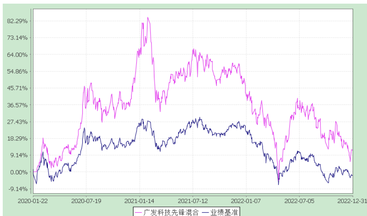
广发科技先锋混合型证券投资基金 份额累计净值增长率与业绩比较基准收益率的历史走势对比图 (2020 年 1 月 22 日至 2022 年 12 月 31 日)