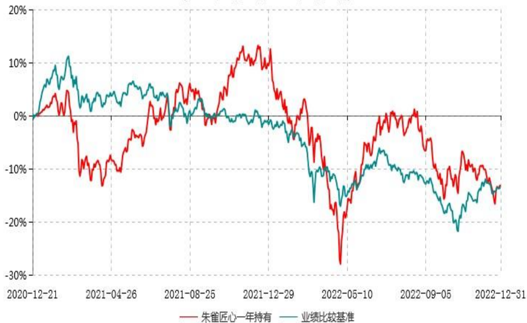
朱雀匠心一年持有期混合型证券投资基金累计净值增长率与业绩比较基准收益率历史走势对比图 (2020年12月21日-2022年12月31日)