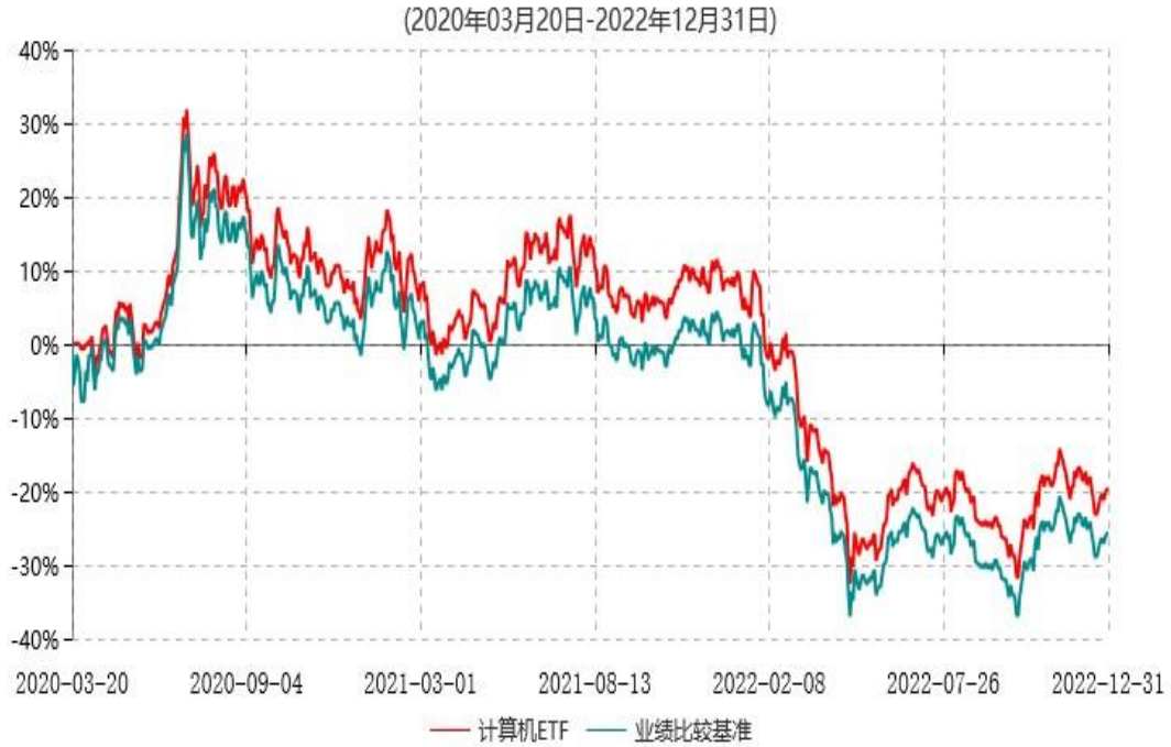
天弘中证计算机主题交易型开放式指数证券投资基金累计净值增长率与业绩比较基准收益率历史走势对比图