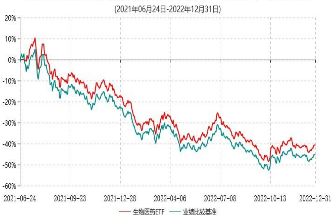
天弘国证生物医药交易型开放式指数证券投资基金累计净值增长率与业绩比较基准收益率历史走势对比图