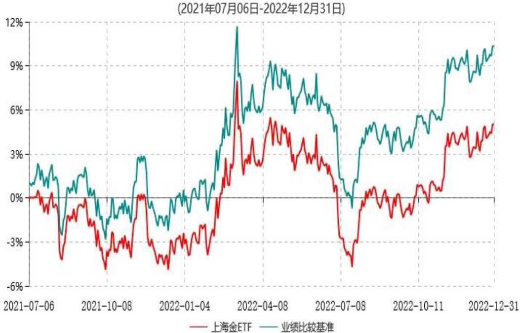
天弘上海金交易型开放式证券投资基金累计净值增长率与业绩比较基准收益率历史走势对比图