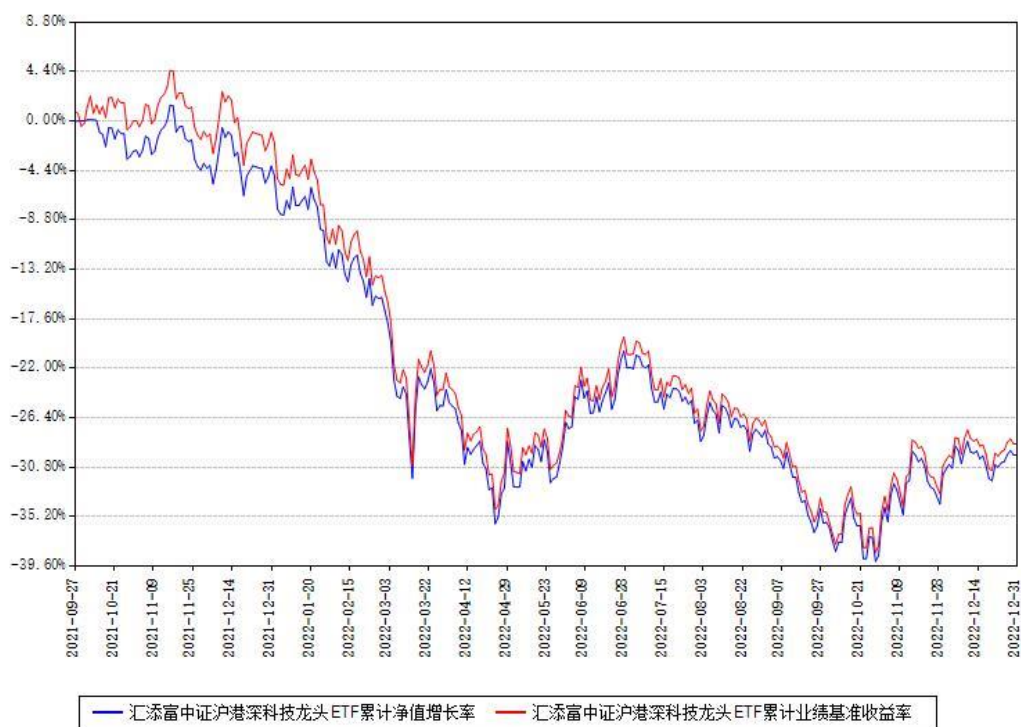
汇添富中证沪港深科技龙头ETF累计净值增长率与同期业绩基准收益率对比图

注：本基金建仓期为本《基金合同》生效之日（2021年09月27日）起6个月，建仓期结束时各项资产配置比例符合合同约定。