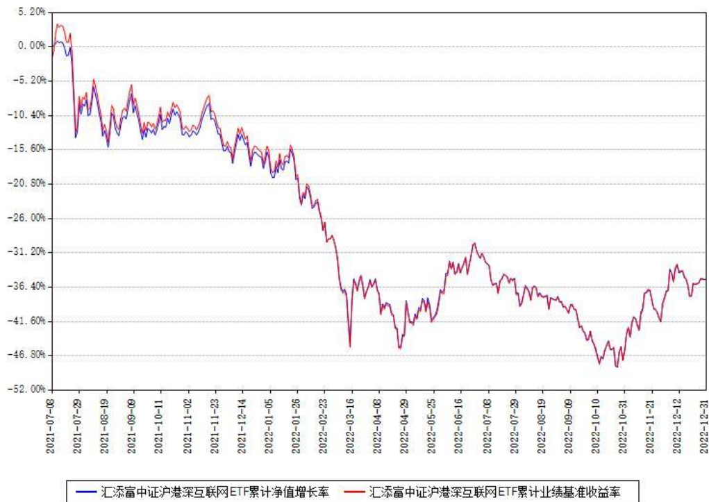
汇添富中证沪港深互联网ETF累计净值增长率与同期业绩基准收益率对比图

注：本基金建仓期为本《基金合同》生效之日（2021年07月08日）起6个月，建仓期结束各项资产配置比例符合合同约定。