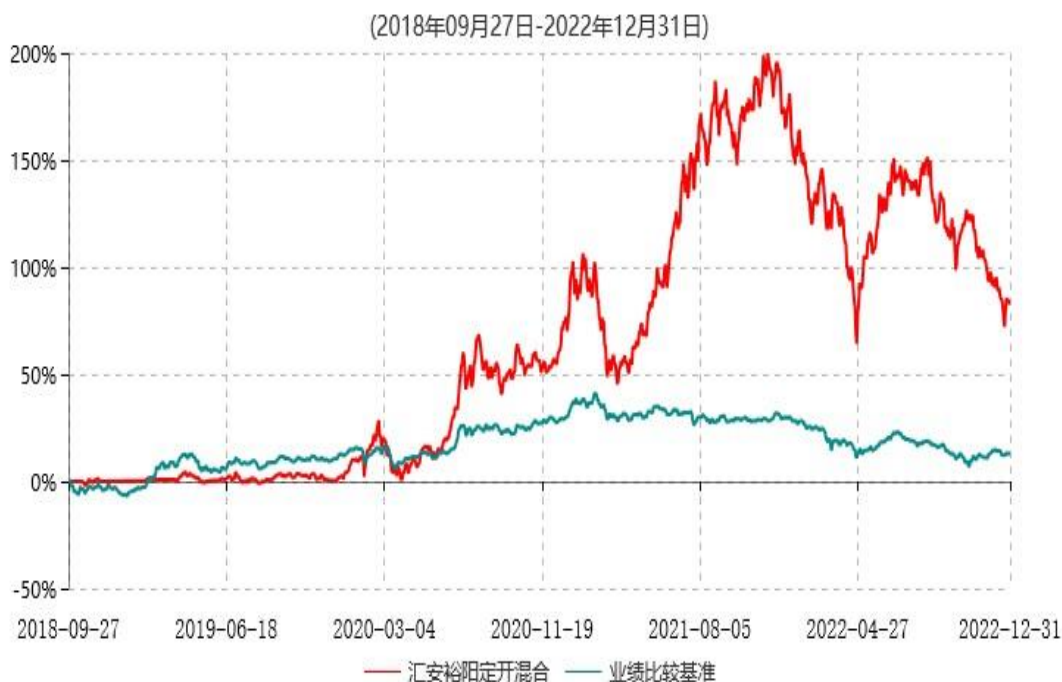
汇安裕阳三年定期开放混合型证券投资基金累计净值增长率与业绩比较基准收益率历史走势对比图