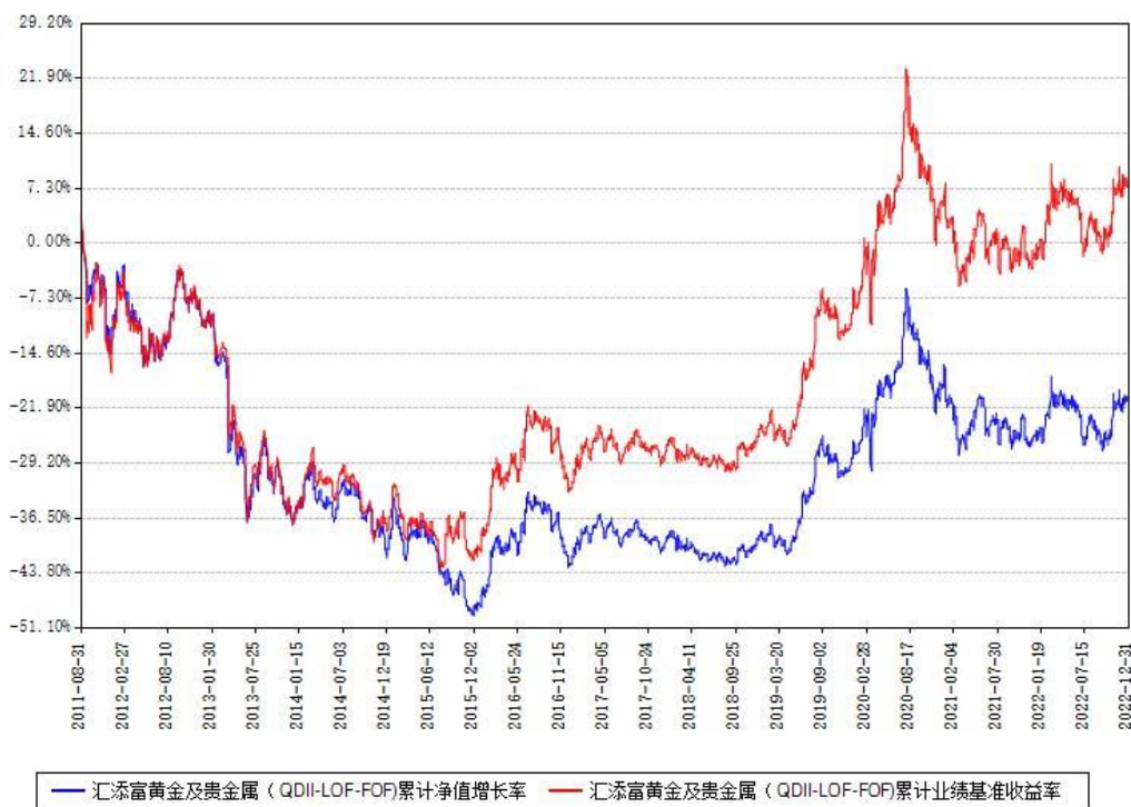
汇添富黄金及贵金属（QDII-LOF-FOF）累计净值增长率与同期业绩比较基准收益率对比图

注：本基金建仓期为本《基金合同》生效之日（2011年8月31日）起6个月，建仓期结束时各项资产配置比例符合合同约定。