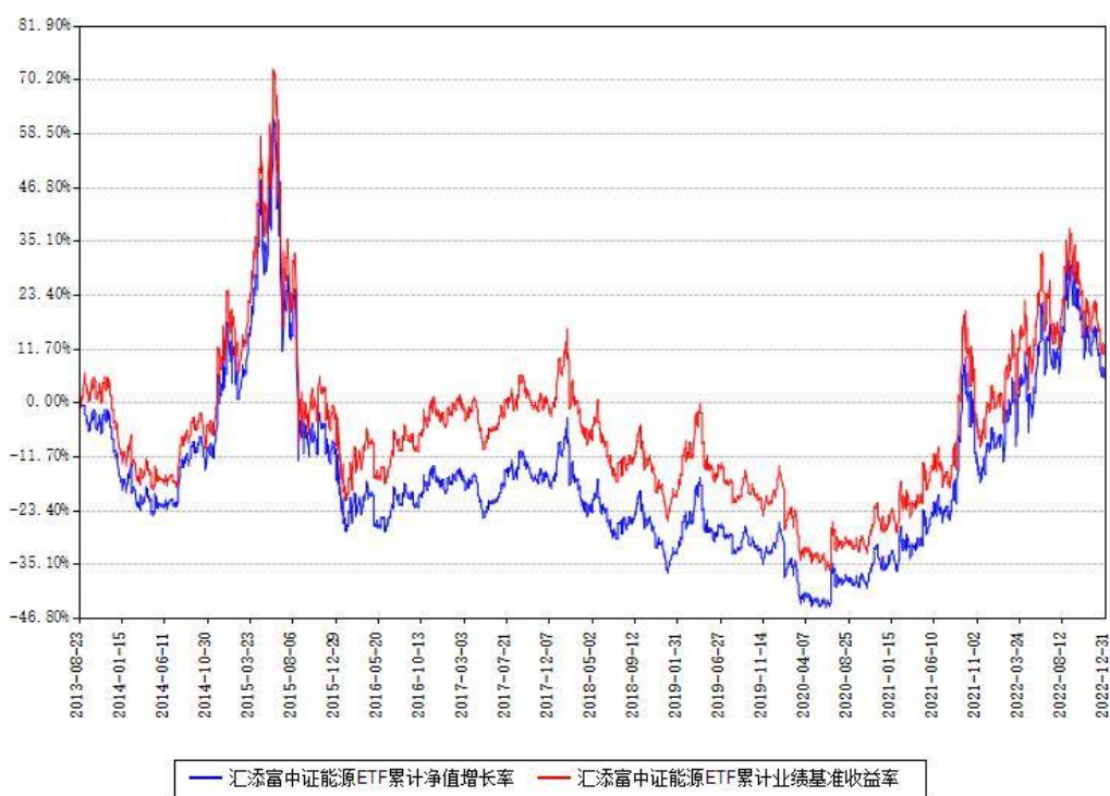
汇添富中证能源ETF累计净值增长率与同期业绩基准收益率对比图

注：本基金建仓期为本《基金合同》生效之日（2013年08月23日）起3个月，建仓期结束时各项资产配置比例符合合同约定。