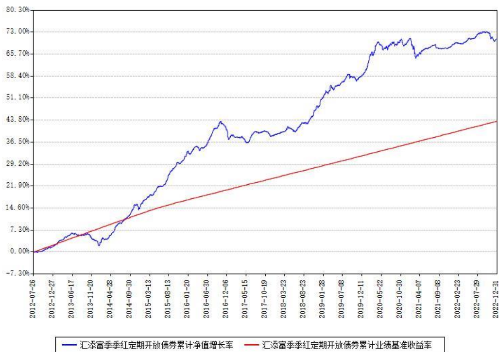
汇添富季季红定期开放债券累计净值增长率与同期业绩比较基准收益率对比图

注：本基金建仓期为本《基金合同》生效之日（2012年07月26日）起6个月，建仓期结束时各项资产配置比例符合合同约定。