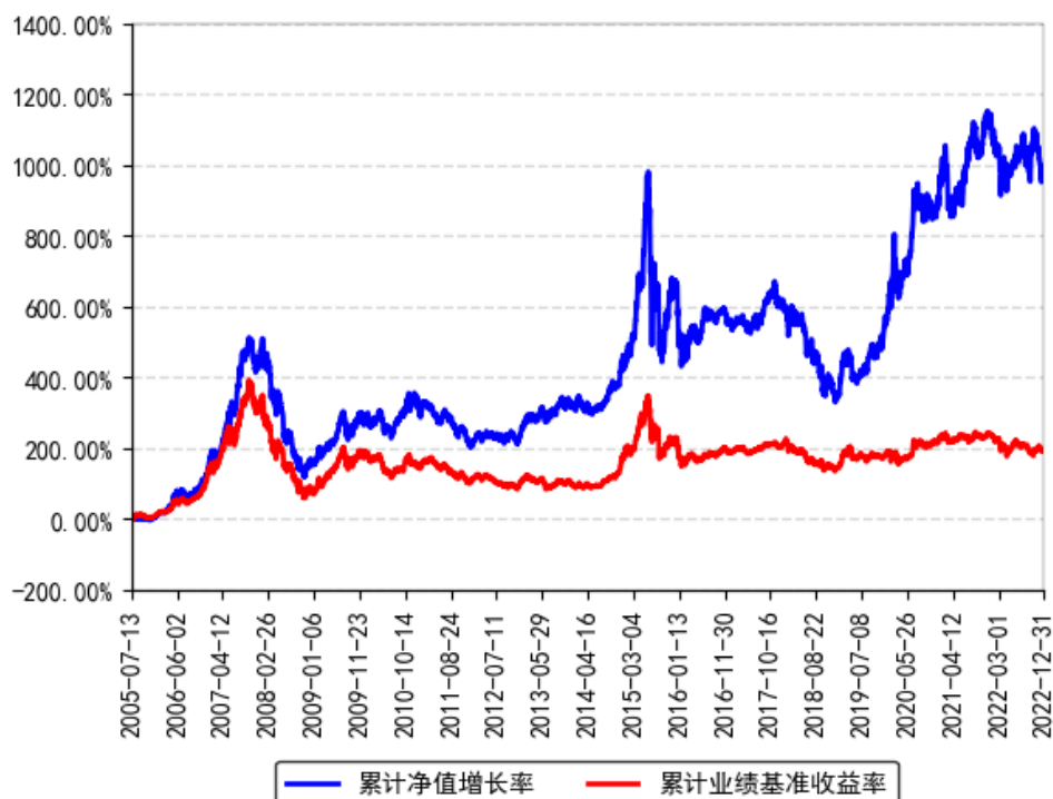
南方高增长混合（LOF）累计净值增长率与同期业绩比较基准收益率的历史走势对比图