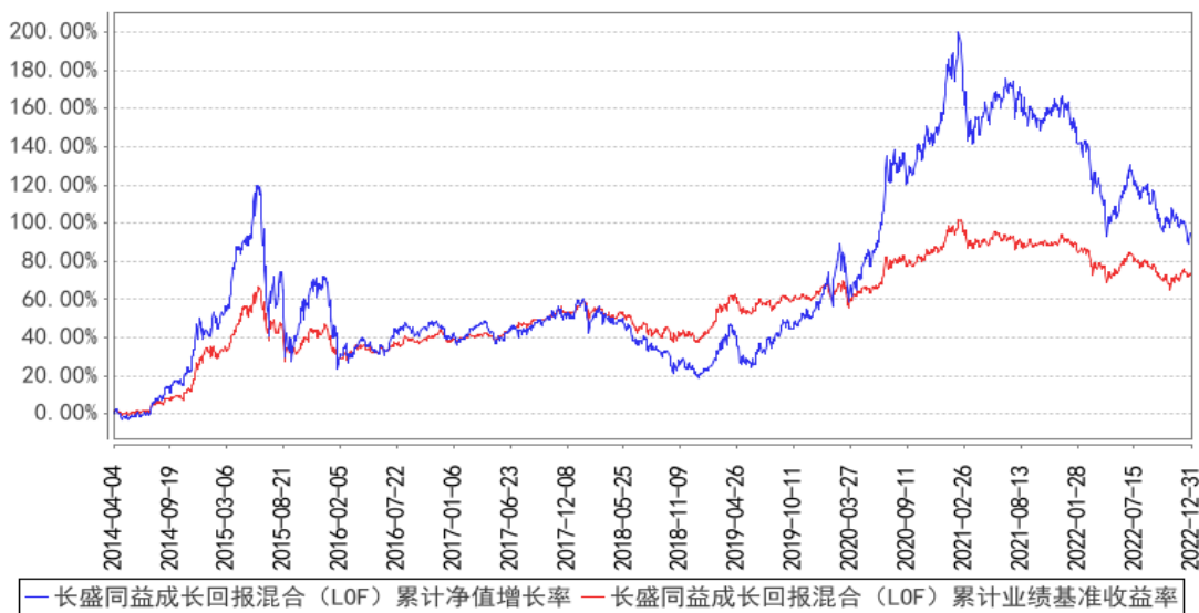
长盛同益成长回报混合（LOF）累计净值增长率与同期业绩比较基准收益率的历史走势对比图

注：1、长盛同益成长回报灵活配置混合型证券投资基金（LOF）由同益证券投资基金转型而来，转型日期为 2014 年 4 月 4 日（即基金合同生效日）。