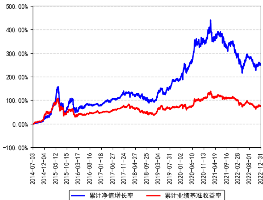
南方天元新产业股票（LOF）累计净值增长率与同期业绩比较基准收益率的历史走势对比图