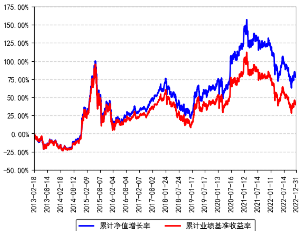
南方沪深300ETF累计净值增长率与同期业绩比较基准收益率的历史走势对比图