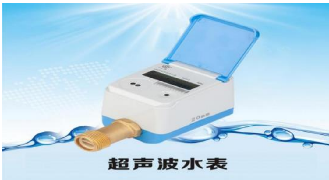
多感知超声波水表

款水表。其主要特点：（1）超声波计量，计量精度高并可计量正、逆向流量；（2）集成水质传感器、温度传感器、压力传感器，可实时判断当前水质的优劣，对超低或超高水温进行预警，对管网压力进行检测，及时发现爆管或渗漏事故；（3）数据海量存储，可循环存储 120 月结数据、120 天日结数据、50 条故障记录、2000 条事件记录；（4）产品具有红外通讯接口，接受固件升级，也可通过通信网络实现远程升级。