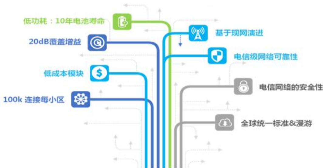
NB-IoT 水表关键技术优势

①NB-IoT 无磁远传水表。NB-IoT 无磁远传水表，是指采用 NB-IoT 通讯技术和无磁传感技术，实现数据远传的智能水表。其主要特点：①无磁传感：采用无磁传感技术，不受外界磁场干扰；②1L 计量：机电转换最小分辨率为 1L，便于做分区计量及用户漏损检测；③NB-IoT 通讯：采用 NB-IoT 无线通讯，安装方便，无需布线；④数据存储：每 30 分钟存储一次，可连续存储 31 天的实时流量数据，可保存最近 18 个月的月结流量数据；⑤低压检测：水表供电电池低压时会主动上报至管理系统，提醒管理人员更换合格电池。