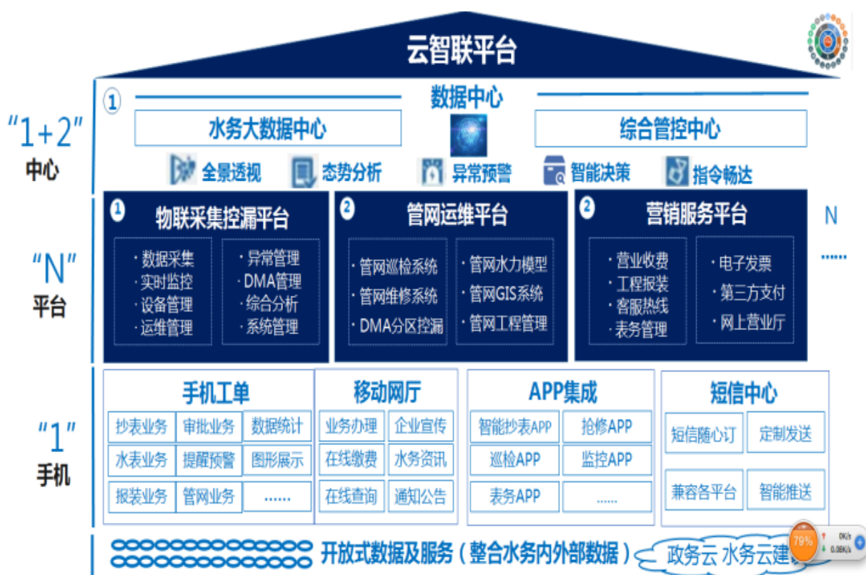
智慧水务云平台架构图

⑤智慧水务云平台（“云智联平台”）。智慧水务云平台是一个信息化、数字化、智慧化的水务移动互联网+SAAS服务平台，融合微服务架构、云原生、前后端分离等核心技术，集成物联网、水务业务管理、数据可视化、大数据分析、数据挖掘及应用一体化的全生态生命周期管理平台。该平台以“NB”水表等智能终端为抓手，以物联网、移动互联网、大数据等新一代信息技术为手段，建设国内领先的信息基础设施，成熟稳定的业务应用，灵活多样的便民服务手段，打造面向公众需求的民生服务、水资源管理及应用体系，健康有序地推动水务行业智慧化建设。智慧水务云平台兼容不同类型、厂商、协议的水表，消除烟囱式系统和数据孤岛，帮助水司实现生产调度（水质管理、二次供水、水厂工艺实时监测）、客服营销（智能抄表和收费系统）、运营管理（GIS系统、外勤系统、工程管理）和定量控漏（DMA分区计量、渗漏预警管理、压力调控管理）四大功能。