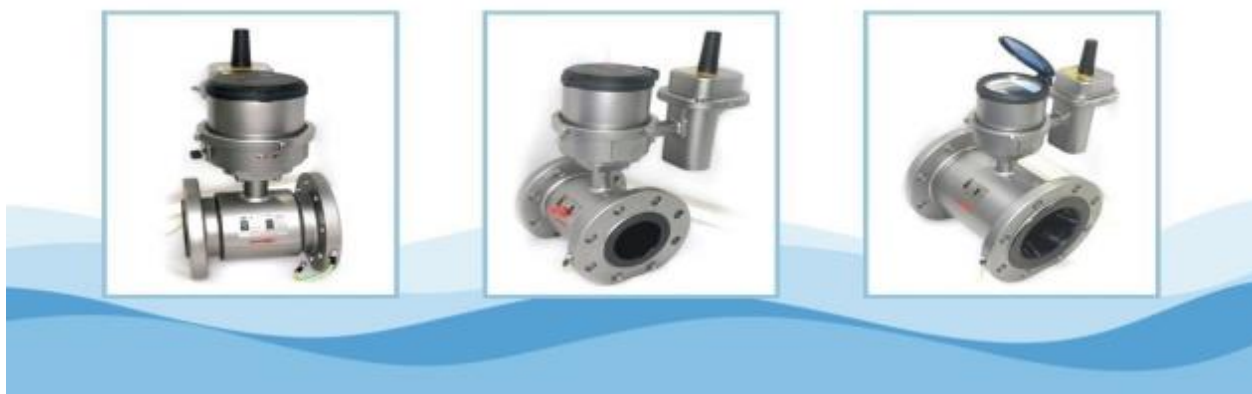
电磁水表实物照片

②电磁水表。电磁水表是一种根据法拉第电磁感应定律来测量管内水流量的感应式计量仪表。与传统机械计量水表比较，电磁水表具有零磨损、低压损、宽量程、高灵敏度、易实现功能扩展等优点。例如可以选配压力传感器，检测安装点管道压力；采用 NB 或 GPRS 数据远传，实现远程抄表。该产品特别适用于管网监测和 DMA 分区计量管理，帮助水司及时发现漏点、减少漏损、降低产销差率。