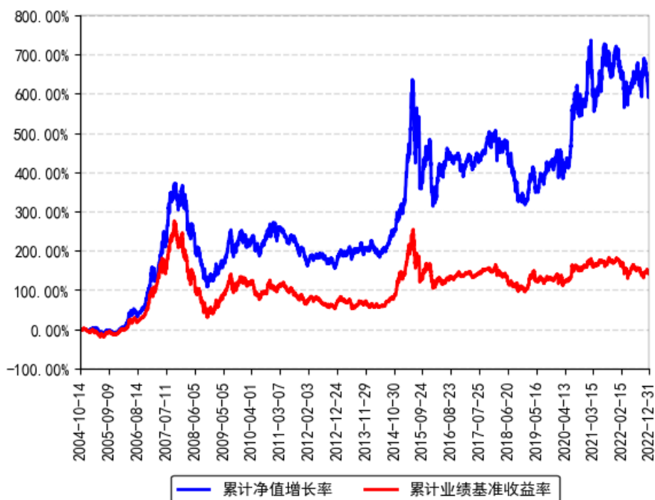
南方积极配置混合（LOF）累计净值增长率与同期业绩比较基准收益率的历史走势对比图