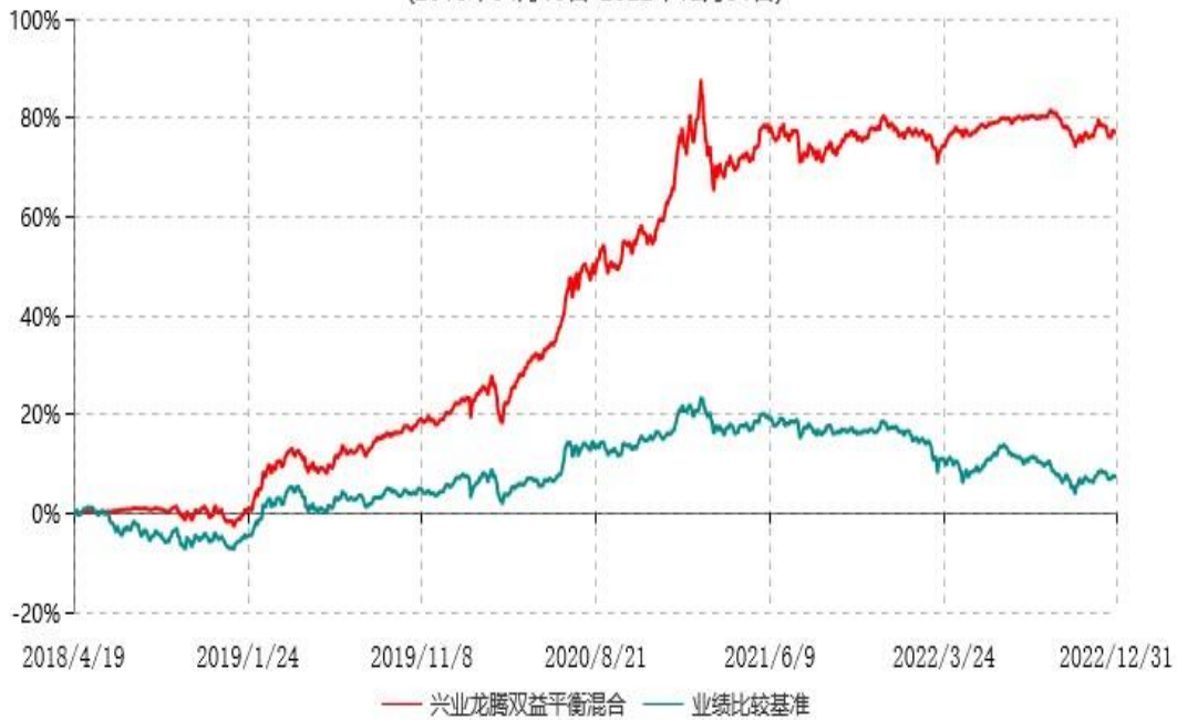
兴业龙腾双益平衡混合型证券投资基金累计净值增长率与业绩比较基准收益率历史走势对比图 (2018年04月19日-2022年12月31日)