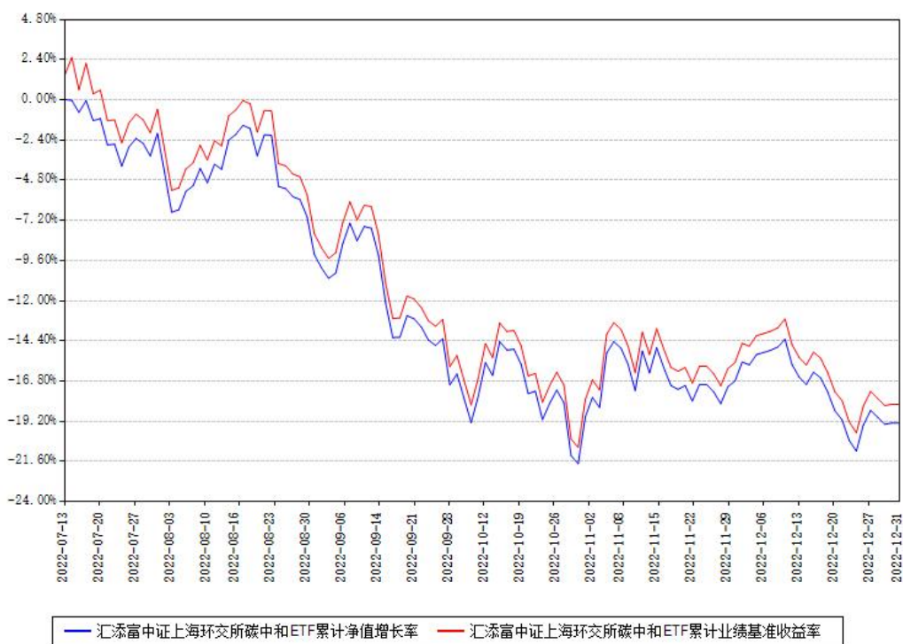
汇添富中证上海环交所碳中和ETF累计净值增长率与同期业绩基准收益率对比图

注：本《基金合同》生效之日为2022年07月13日，截至本报告期末，基金成立未满一年。本基金建仓期为本《基金合同》生效之日起6个月，截至本报告期末，本基金尚处于建仓期中。