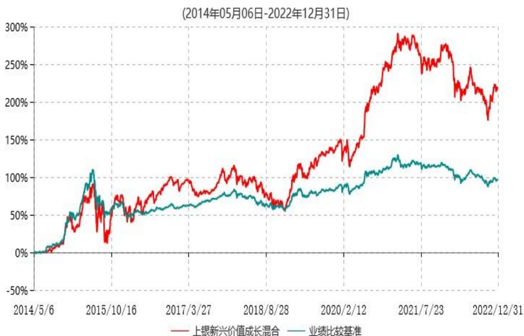
上银新兴价值成长混合型证券投资基金累计净值增长率与业绩比较基准收益率历史走势对比图

注：1、本基金合同生效日为2014年5月6日，自基金合同生效日起6个月内为建仓期，建仓期结束时资产配置比例符合基金合同约定。