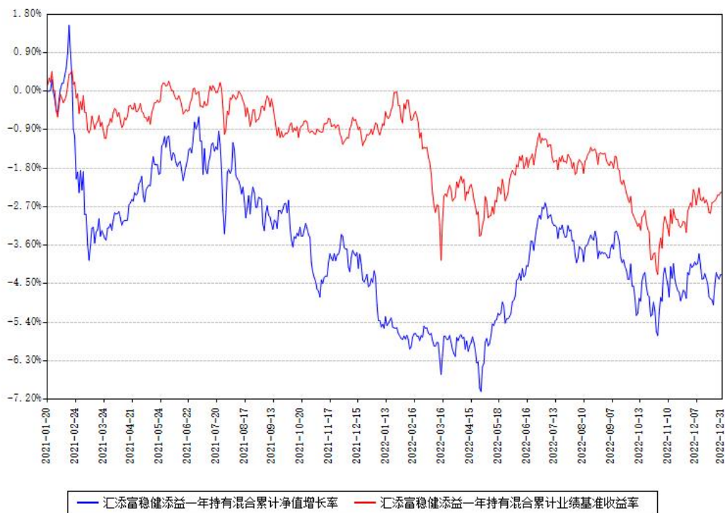
汇添富稳健添益一年持有混合累计净值增长率与同期业绩基准收益率对比图

注：本基金建仓期为本《基金合同》生效之日（2021年01月20日）起6个月，建仓期结束时各项资产配置比例符合合同约定。