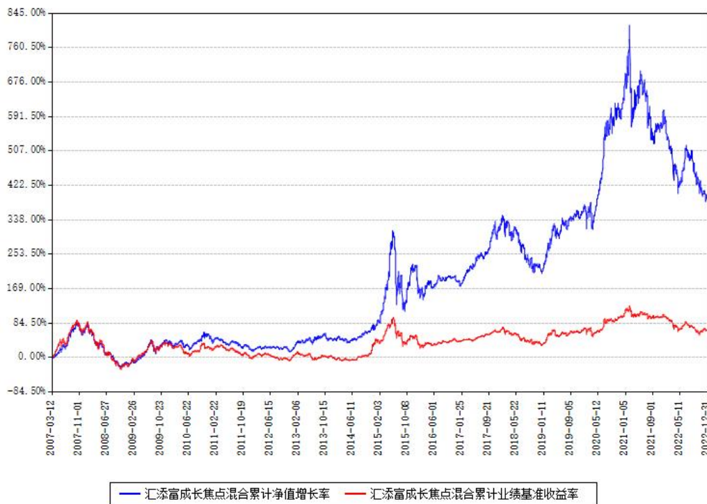
汇添富成长焦点混合累计净值增长率与同期业绩比较基准收益率对比图

注：本基金建仓期为本《基金合同》生效之日（2007年03月12日）起6个月，建仓期结束时各项资产配置比例符合合同约定。